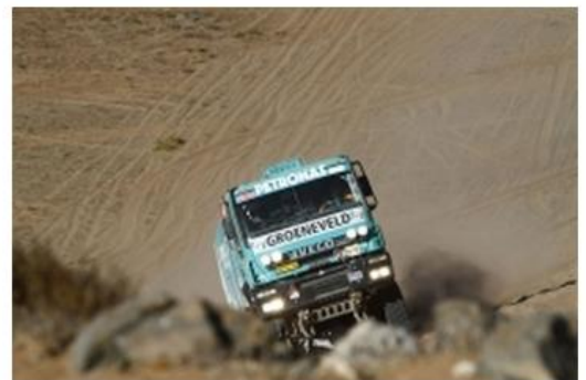
/// Pep VILA -