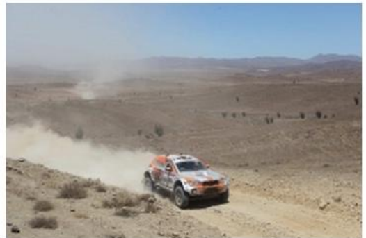
/// Eric BERNARD -

- Les 5 camions de course De Rooy sont dans les 16 premiers au général : une équipe qui tient la route !