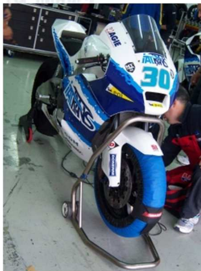
/// Essai Moto2 - 18/11/11 Suter du team Italtrans