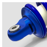
Réglage de détente

NOUVEAU: Donerre propose maintenant le réglage de la butée hydraulique. 5 positions, qui constituent un ajustement efficace et accessible. La butée hydraulique de détente permet aux amortisseurs EFFEX de se substituer à n'importe quel type de sangle de débattement, permettant une meilleure protection du châssis. De plus, l'angle du réservoir peut se régler même lorsque l'amortisseur est sous pression.