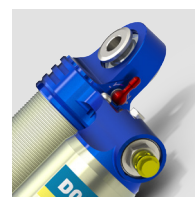
Réglages de compression (haute & basse vitesse) et réglages de la butée Hydraulique de compression