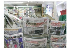
FONDS PRESSE TABAC JEUX