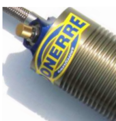
Réservoir à ailettes avec ou sans réglages de compression