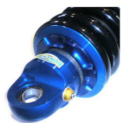
Option: coupelle ressort réglable