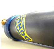
Corps acier Ø 70mm